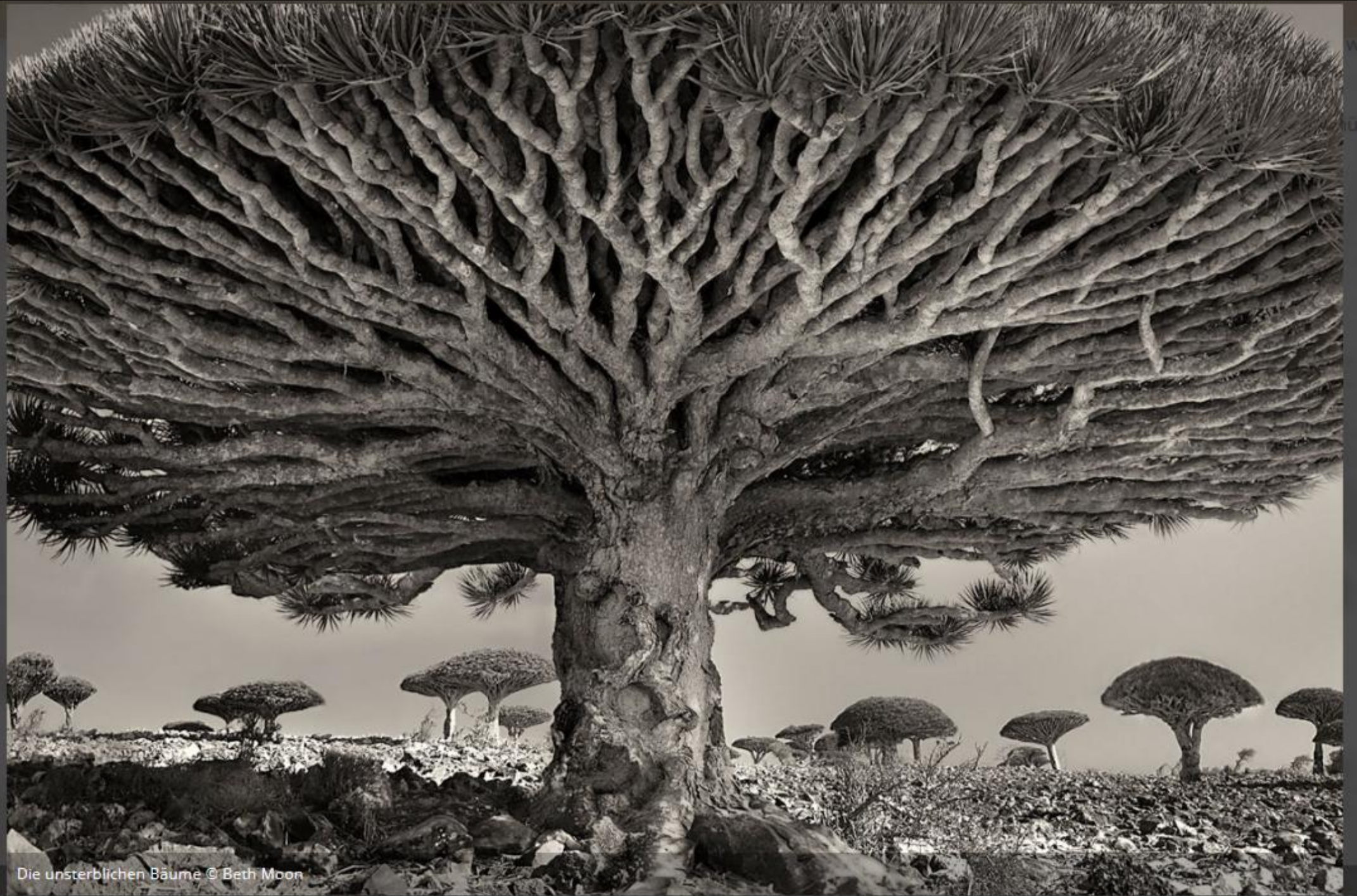
Die unsterblichen Bäume