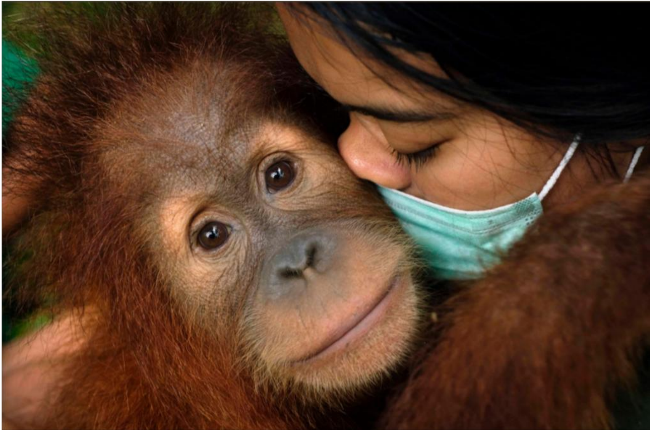
Rettet die Orang Utans!