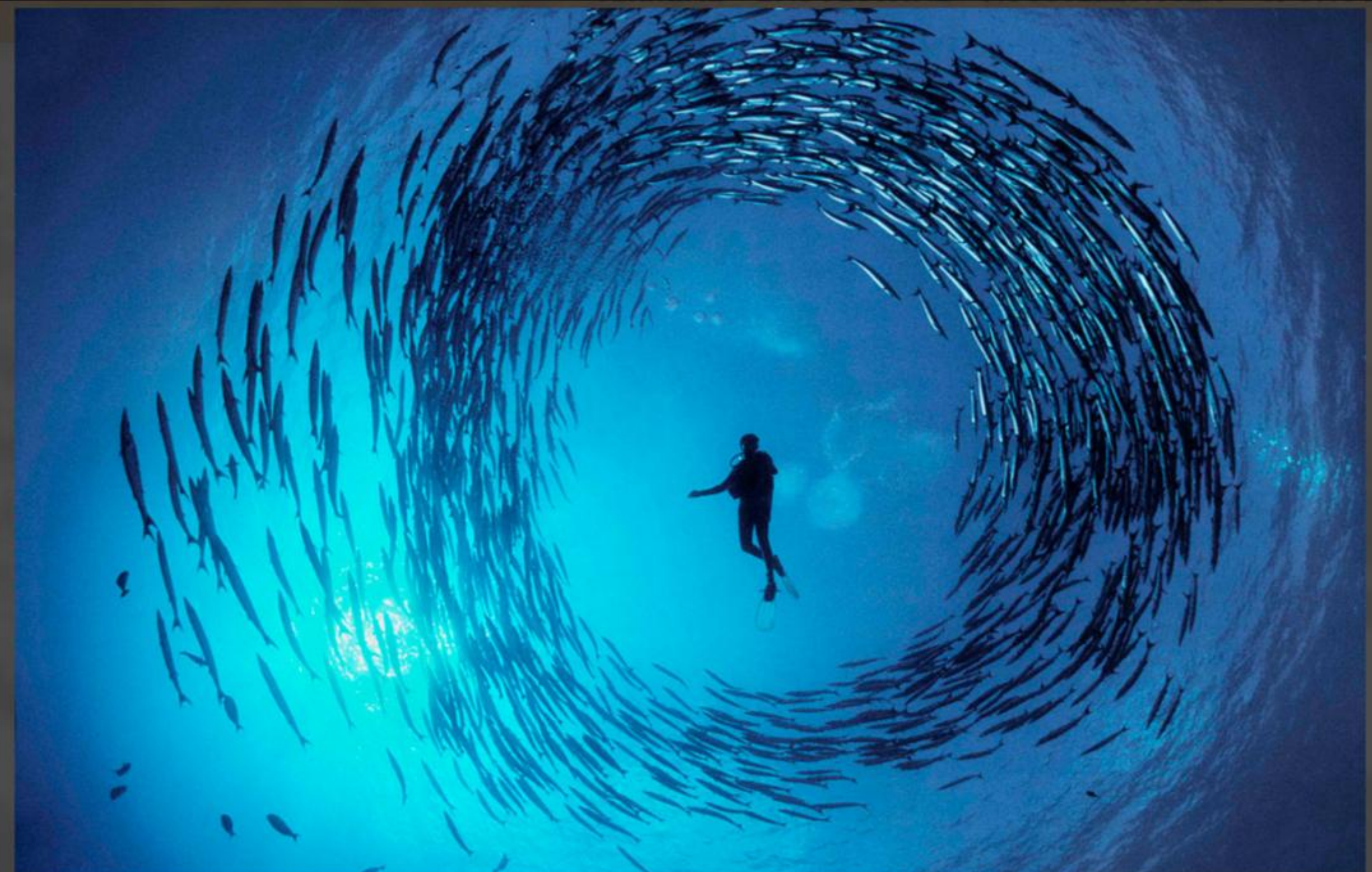
Die Stimmen des Wassers